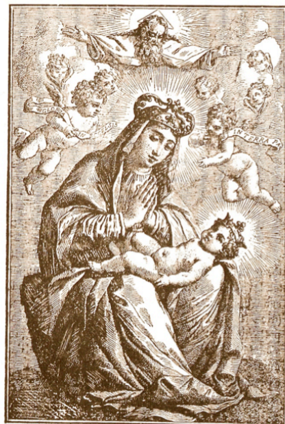
VERO RITRATTO DELLA B. VERGINE DEL SASSO. a Bologna 1800 G. G. G. G.